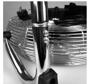
2. Plaats de schroeven.