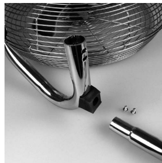
1. Place the base part in the holders of the fan.

Take your time to assemble the fan! If you have any doubt how to do it, please contact a qualified person who can assemble the fan for you.