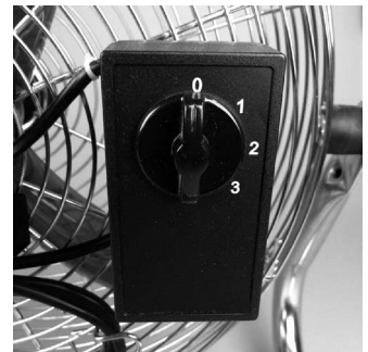
0 = OFF 1 = Low 2 = Medium 3 = High

© Besli 2014 - Het is niet toegestaan om deze handleiding of gedeelten ervan over te nemen, te kopiëren, te vertalen, te bewerken zonder voorafgaande schriftelijke toestemming van de rechthebbende.