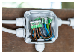
Wiring in the distribution box