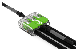
Testing via test slots