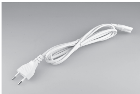
Aansluitsnoer 1,5 meter.