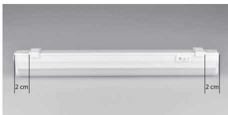
Hangmontage (Beugels +/- 2 cm van het uiteinde).