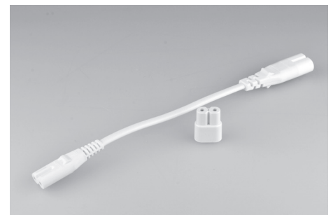
Koppelsnoer / koppelstuk.